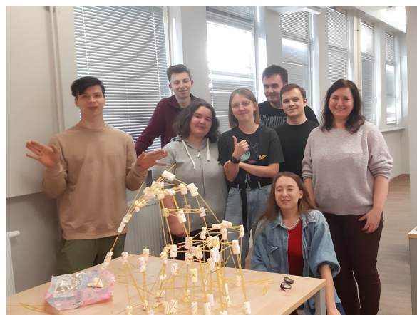
Zajęcia z Podstaw pracy grupowej i komunikacji interpersonalnej, "Wylaniamy lidera"

Specjalność Psychologia Pracy, Organizacji i Zarządzania – miejscami pracy mogą być instytucje publiczne, oraz prywatne zakłady pracy w których zatrudniony psycholog realizuje zadania i obowiązki związane z zarządzaniem zasobami ludzkimi (HR), uczestniczy w procesach rekrutacji i selekcji tworzy narzędzia motywacji pracowników, monitoruje aspekt bezpieczeństwa psychospołecznego pracowników, prowadzi szkolenia dla kadry menadżerskiej i zarządzającej.