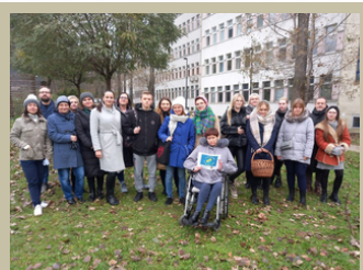
Sadzenie żonkili przed Biblioteką Uniwersytecką akcja "POLA NADZIEI - RAZEM DLA LUBUSKICH HOSPICJÓW" 29.11.2022 r.