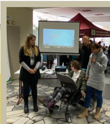
Pokaz komunikacji alternatywnej: spotkanie "ZROZUMIEĆ NIEZRÓZUMIANYCH" 7.12.2022 r.