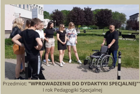
Przedmiot: "WPROWADZENIE DO DYDAKTYKI SPECJALNEJ" I rok Pedagogiki Specjalnej