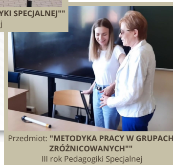
Przedmiot: "METODYKA PRACY W GRUPACH ZRÓŻNICOWANYCH" III rok Pedagogiki Specjalnej