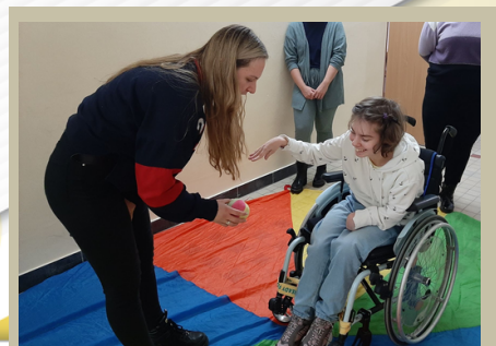
Zaliczenie przedmiotu: "DIAGNOZA FUNKCJONALNA OSÓB Z NIEPEŁNOSPRAWNOŚCIĄ INTELEKTUALNĄ" IV rok Pedagogiki Specjalnej